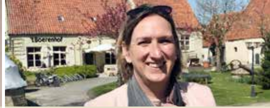
Doorbraak in dossier 't Boerenhof (p.3)