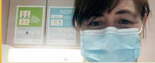
Een boodschap van onze mandatarissen (p.2)